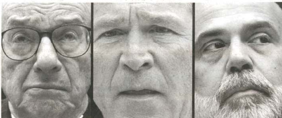
Bush entre Alan Greenspan - anterior Presidente de la Reserva Federal - y Ben Bernake actual Presidente de la FED

"El problema es que los Estados Unidos tienen uno de los peores sistemas monetarios: un Banco Central que opera independientemente del gobierno y que, con otros bancos privados, crea todo nuestro dinero con, deudas, en paralelo, que reportan intereses. Es por ello que nunca se podrá salir de las deudas. Es por ello también que la mayor parte de los ciudadanos norteamericanos están convencidos de la proximidad de una gran crisis financiera, sea causada brutalmente por un quiebre económico serio, sea llevada gradualmente por una inflación galopante. La FED prepara esto para enriquecer sus accionistas privados, así como ha provocado deliberadamente la crisis de los años 30. Es necesario saber que el objetivo de la alta finanza norteamericana es el de establecer una moneda global que ella controlaría. La alta finanza de los Estados Unidos eligió al Banco de Pagos Internacionales (el acrónimo en inglés es BIS), un organismo privado. Si el BIS llegara a ser el Banco Central emi-