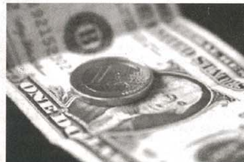
Greenspan: "a partir de 2007, habría una fusión del dólar y el euro, en eurodólares, una nueva moneda mundial"