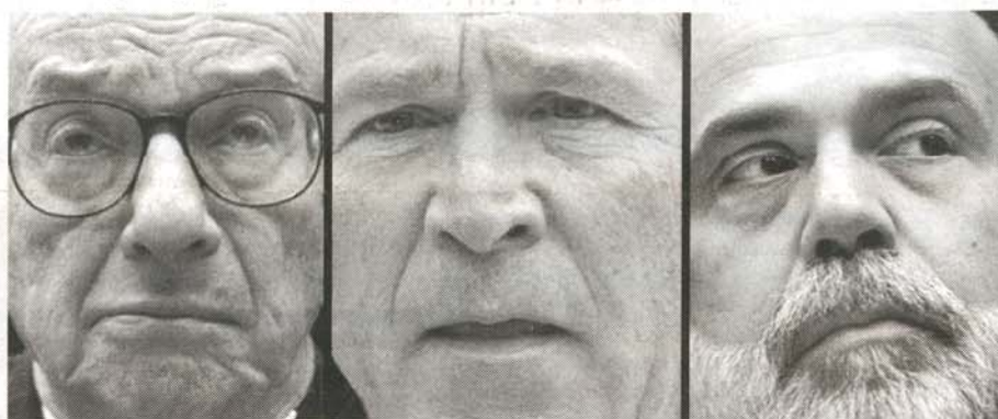
Bush entre Alan Greenspan - anterior Presidente de la Reserva Federal - y Ben Bernake actual Presidente de la FED

"El problema es que los Estados Unidos tienen uno de los peores sistemas monetarios: un Banco Central que opera independientemente del gobierno y que, con otros bancos privados, crea todo nuestro dinero con, deudas, en paralelo, que reportan intereses. Es por ello que nunca se podrá salir de las deudas. Es por ello también que la mayor parte de los ciudadanos norteamericanos están convencidos de la proximidad de una gran crisis financiera, sea causada brutalmente por un quiebre económico serio, sea llevada gradualmente por una inflación galopante. La FED prepara esto para enriquecer sus accionistas privados, así como ha provocado deliberadamente la crisis de los años 30. Es necesario saber que el objetivo de la alta finanza norteamericana es el de establecer una moneda global que ella controlaría. La alta finanza de los Estados Unidos eligió al Banco de Pagos Internacionales (el acrónimo en inglés es BIS), un organismo privado. Si el BIS llegara a ser el Banco Central emi-