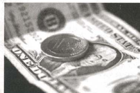
Greenspan: "a partir de 2007, habría una fusión del dólar y el euro, en eurodólares, una nueva moneda mundial"