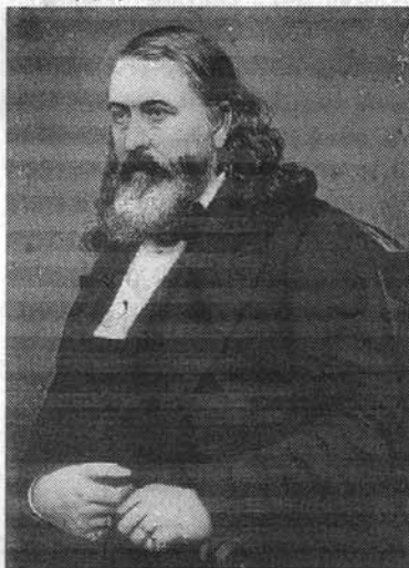
Albert Pike, celebre masón norteamericano.

Por ejemplo, cuando se desalojó a la Logia Italiana del Gran Oriente del Palazzo Bourghese en Roma, en 1893, el propietario encontró un lugar sagrado dedicado a Satanás. Los masones italianos publicaron un diario en los años 1880 donde confesaron en varias oportunidades que "¡Nuestro líder es Satanás!" (135)