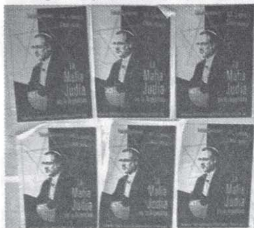
Afiches de la tapa del libro "La Mafía Judía en la Argentina" pegados sobre la calle Moreno, en la intersección con Diagonal Sur.

PATRIA ARGENTINA no se editará en el mes de FEBRERO de 2009