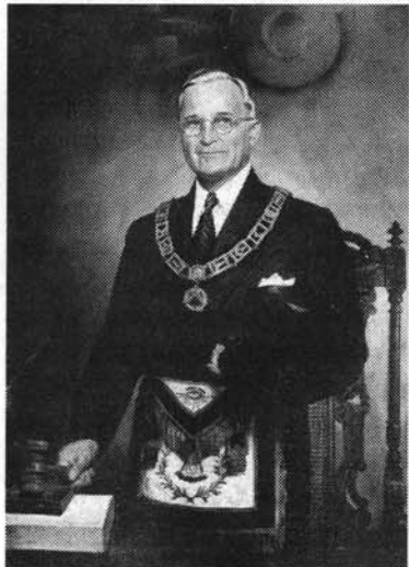
Presidente Harry Truman -un "filántropo" masón- revestido con los ornamentos masónicos

El 6 de agosto de 1945 el presidente norteamericano Harry Truman orgulloso dijo: "hace 16 horas que un avión estadounidense ha lanzado una bomba sobre Hiroshima... si ahora no aceptan nuestras condiciones, les espera un diluvio de destrucción como jamás se ha visto".