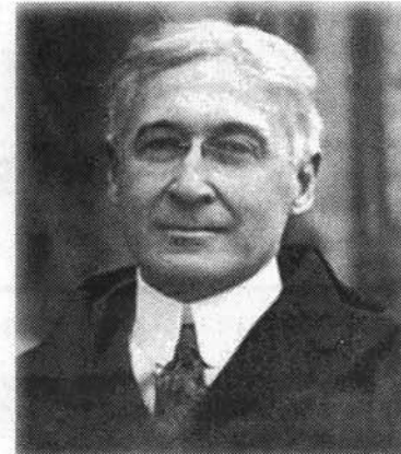
Bernard Baruch. Asesor de 7 presidentes de EE.UU., desde Wilson a Nixon (1912-1965).

mundo quedó atrapado en una contradicción dialéctica que instauró una falsa, arbitraria y artificial realidad cultural, política, militar y económica. Una muestra palpable de ello lo constituyó la disolución