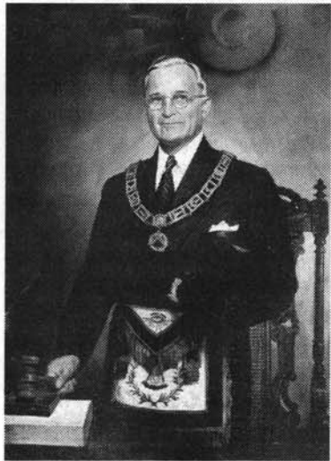
Presidente Harry Truman -un "filántropo" masón- revestido con los ornamentos masónicos

El 6 de agosto de 1945 el presidente norteamericano Harry Truman orgulloso dijo: "hace 16 horas que un avión estadounidense ha lanzado una bomba sobre Hiroshima... si ahora no aceptan nuestras condiciones, les espera un diluvio de destrucción como jamás se ha visto".