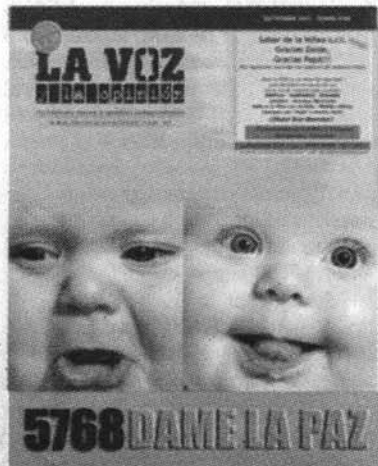
Publicación LA VOZ Y LA OPINION de los meses de agosto-septiembre de 2007, de distribución gratuita

El Che, sacudido por la revelación aprende que, según la tradición judía, él es un judío y que en el viejo mundo él tiene parientes cercanos por línea materna. Celia sabía por sus padres que su hermano Samuel, dieciocho años mayor que ella, había permanecido en Rusia. Como su hermana, él salió de la casa de sus padres, por razones sionistas rumbo a Palestina, después de rechazar ir a la Argentina.